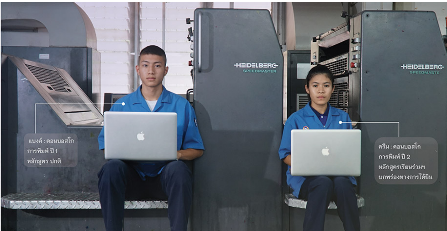
แบงค์ : คอนบอสโก การพิมพ์ ปี 1 หลักสูตร ปกติ